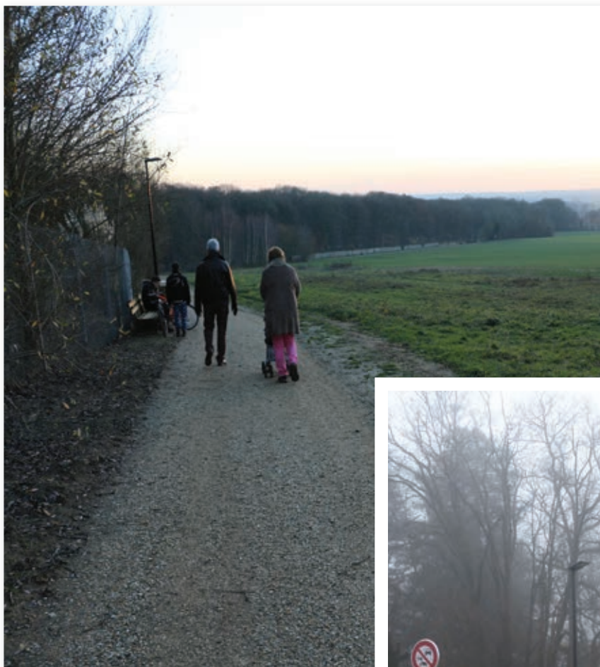
Pour le bonheur des promeneurs ...