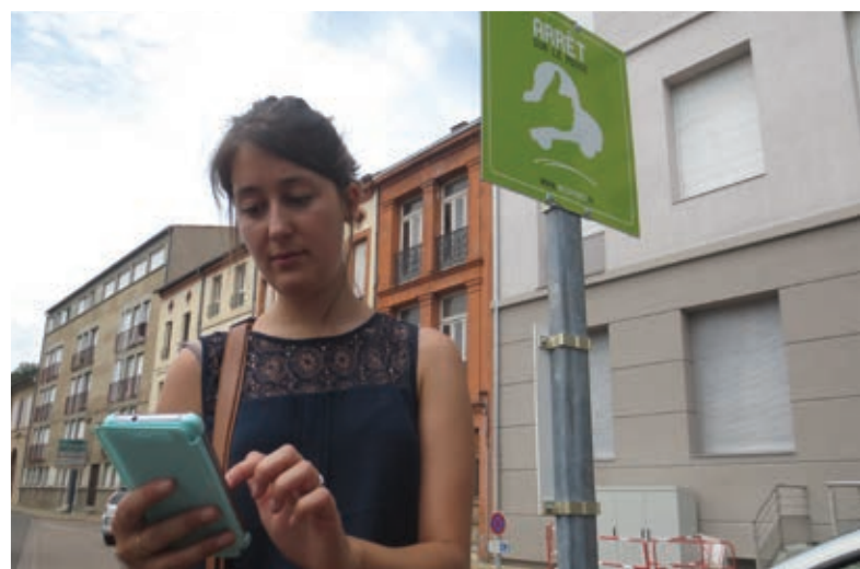
Cette dame n'attendra pas longtemps !

Gratuit et basé sur la solidarité, Rezo Pouce apporte bien plus qu'une solution de mobilité locale et contribue à une vie rurale plus conviviale. Plus nous serons