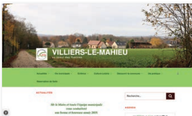
la page d'accueil du site

La vie d'un village ne peut s'enrichir que si elle est connue et partagée. Quel est l'ordre du jour du prochain conseil municipal ? Comment inscrire ses enfants au centre de loisirs ou à la cantine ? Quelle est la prochaine manifestation organisée à la salle des fêtes ? Quand passeront les encombrants ? L'accueil en mairie répond évidemment à toutes ces questions mais il existe également un outil simple, ouvert 7 jours sur 7 et 24 heures sur 24 : le site web communal www.villiers-le-mahieu.fr !