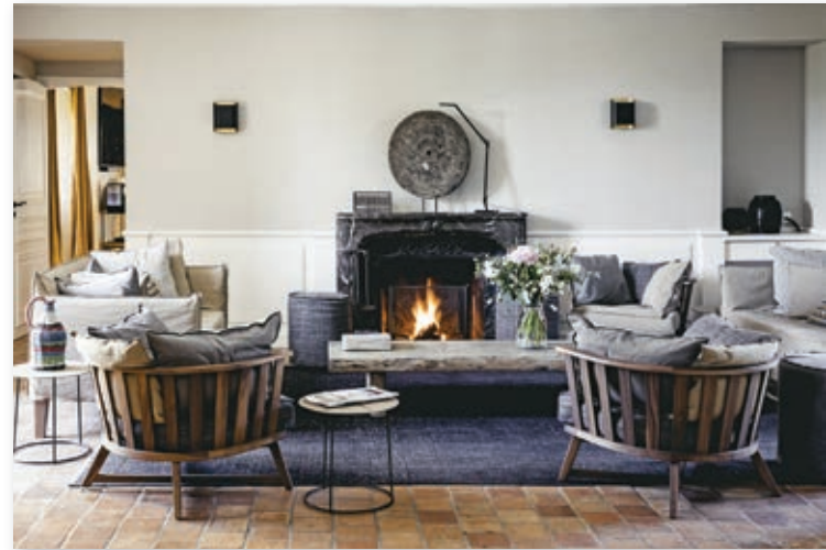
Nouvelle décoration intérieure

C'est à partir de ce constat simple et si évident que Les Maisons de Campagne sont nées.