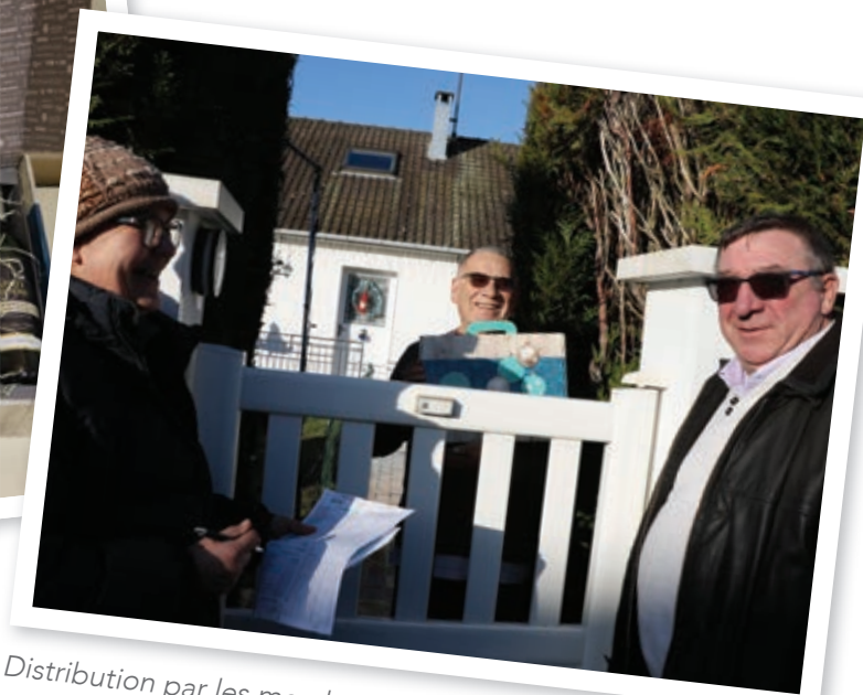
Distribution par les membres du CCAS