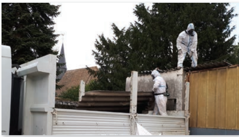
Rénovation des ateliers : enlèvement des plaques amiantées ...

Concernant le premier point, les boiseries extérieures de la micro-crèche ont été lasurées. La façade de l'entrée principale (parties métalliques et boisées) de la salle des fêtes a aussi été rénovée. Le mur gauche de l'entrée de la salle des fêtes, soutenant le grand portail qui menaçait de s'effondrer, a été démolit et reconstruit. La toiture du local de stockage de matériel, situé au fond de la cour de la salle des fêtes, a été refaite à neuf. En effet, trois éléments principaux de la charpente étaient fortement détériorés à cause d'infiltrations de pluie. Cette toiture de 100m 2 , composée de tôles en fibrociment, contenant de l'amiante, a nécessité de faire appel à une entreprise spécialisée en désamiantage. Cette opération est très réglementée et obligatoire.