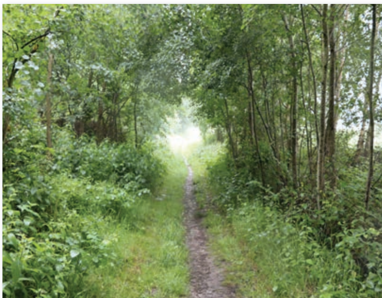
La voie avant les travaux

L'absence de trottoir et d'éclairage le long de la route RD 45 pose un vrai problème de sécurité pour les piétons et cyclistes qui souhaitent se rendre à Thoiry. De nombreux commerces et services (l'école maternelle intercommunale, un bureau de poste, des médecins, etc.) se situent pourtant dans cette commune, sans oublier l'arrêt du bus 78 reliant Mantes à Saint-Quentin-en-Yvelines.