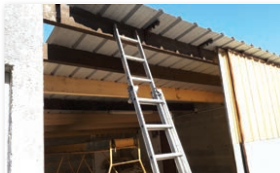
Rénovation des ateliers : pose de la nouvelle toiture

La charpente réparée a été recouverte par la nouvelle toiture réalisée en tôles « bac acier » anti-condensation. La partie du mur du cimetière, qui avait été étagée afin d'éviter l'éboulement, a été également démolie et reconstruite. Pendant la durée des travaux, les tombes, situées à proximité, ont fait l'objet d'une protection très soignée. Une entreprise de pompes funèbres est intervenue pour démonter puis remonter la partie verticale de trois d'entre elles. La toiture de la chaufferie dédiée à la 3 ème classe et à la garderie a été refaite à neuf, en urgence, car bon nombre de tuiles s'effritaient. La toiture du préau jouxtant cette chaufferie a été démoussée et traitée. Enfin, silencieux pendant de trop longs mois, le tintement de la cloche de la pendule de la mairie s'est à nouveau fait entendre pour le grand bonheur