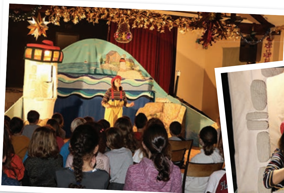
Le mystère du phare

Cette année, la compagnie itinérante « Debout les Rêves », spécialisée dans les spectacles jeune public, a présenté « Le mystère du phare ». Les enfants ont aidé Edgar, le gardien du phare, à résoudre une énigme en déchiffrant un rébus géant. Le spectacle terminé, le Père Noël est venu distribuer ses cadeaux aux enfants ravis. L'après-midi s'est terminée par un goûter très animé.