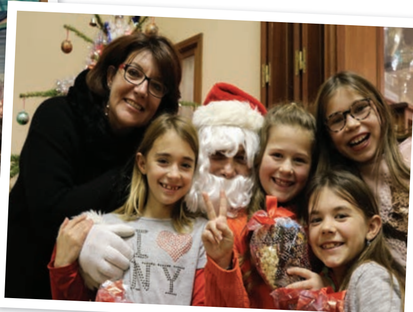
La distribution des cadeaux