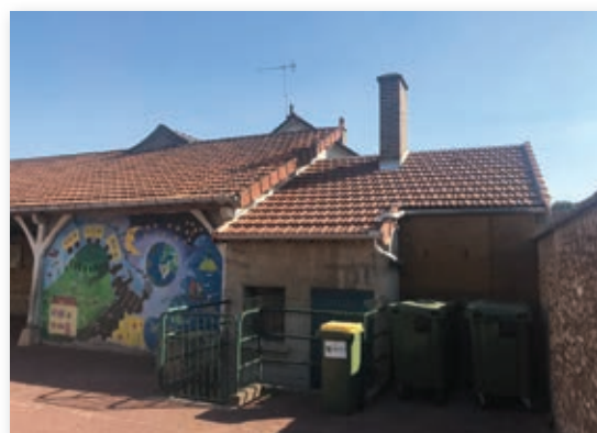
Nouvelle toiture pour la chaufferie