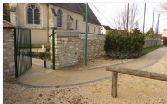
Accès à l'église via le terrain de foot