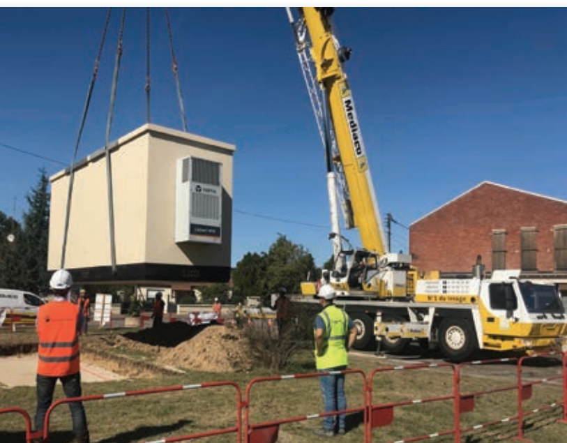
Dépose d'un NRO