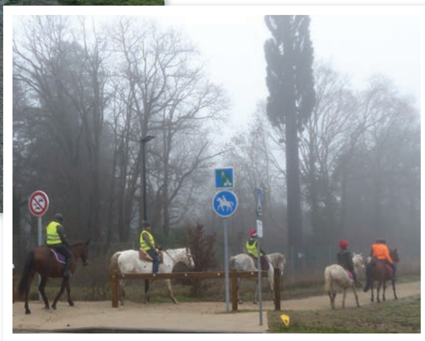
... et des cavaliers

travaux et l'impact carbone lié aux transports. Les eaux de ruissellement ont été récupérées dans des fossés latéraux puis dans une noue infiltrante de 100 m 3 . Enfin, 18 lampadaires à ampoules LED éclairent la voie, la nuit tombée (sauf entre 23 heures et 5 heures) pour le confort et la sécurité de tous.