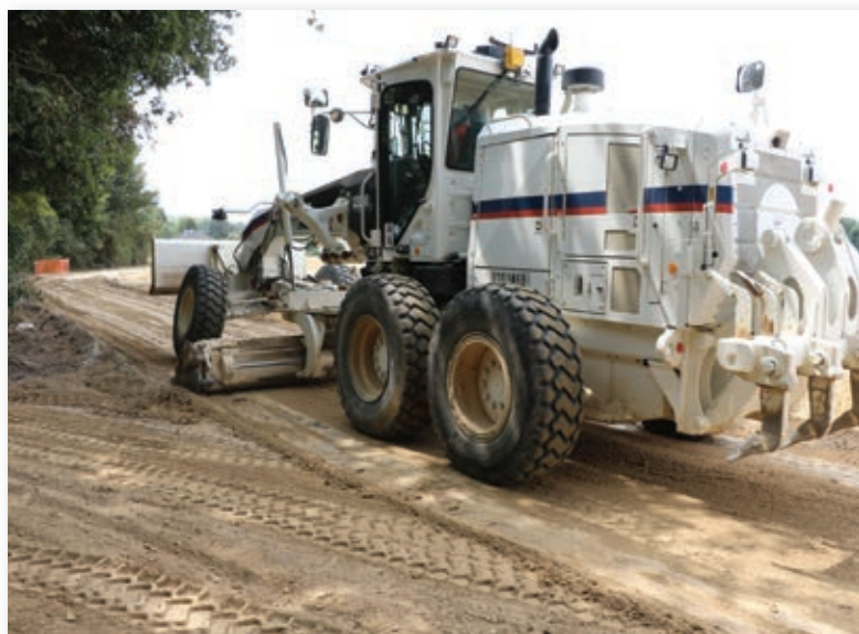
Les engins de nivellement au travail

La longueur totale de la voie douce est de 800 mètres. Sur toute sa longueur, une tranchée technique d'un mètre de profondeur a été réalisée pour enfouir 3 fourreaux destinés à l'éclairage et au passage de la fibre optique. Les 180 premiers mètres, dans le prolongement du chemin du Parc, côté Villiers-le-Mahieu, ont été renforcés en gravillonnage pour permettre aux engins agricoles d'accéder aux parcelles en exploitation. Le reste de la voie a une largeur de