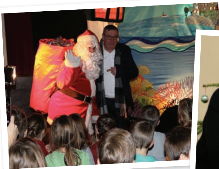
L'arrivée du Père Noël