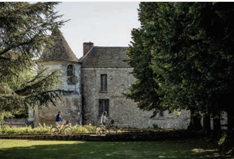
Ballade à bicyclette autour du château