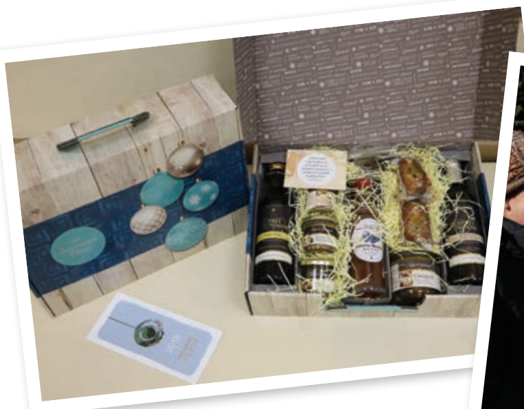
Le coffret offert aux anciens

Quelques jours avant Noël, l'équipe du CCAS a distribué près de 100 colis aux « anciens » de la commune.