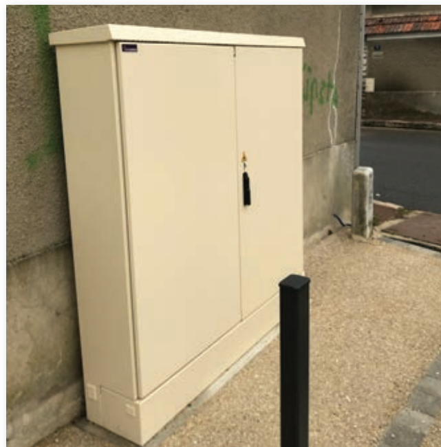
L'armoire de rue à Villiers-le-Mahieu

Bouygues Telecom et quelques opérateurs alternatifs ont d'ores et déjà contractualisé avec Yvelines Fibre. Mais