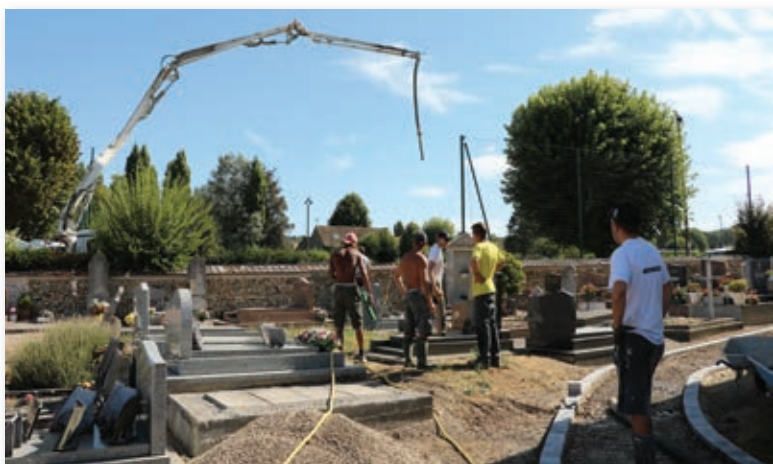
Construction d'un accès à l'église pour les personnes handicapées