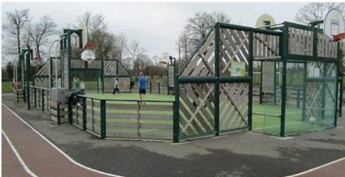
Exemple de maquette envisagée pour le terrain multisports