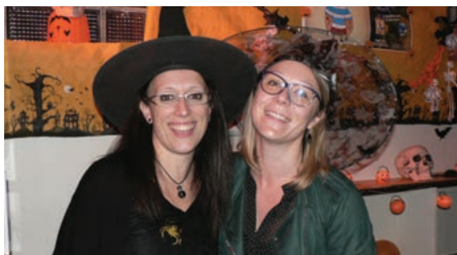
Et que dire des parents ?