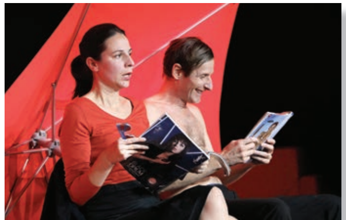
« les emmerdeurs » à la plage

La seconde animation proposée était une soirée « Théâtre et Beaujolais », concept novateur qui résume bien à lui seul les inspirations hétéroclites de l'équipe. Le pari a été pleinement réussi : salle (plus que) comble, deux comédies de qualité et un bon moment de convivialité autour d'assiettes de charcuterie et ... de verres de Beaujolais.