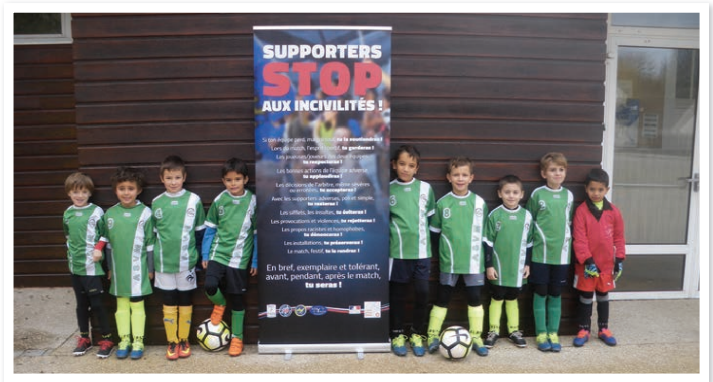
Les jeunes débutants

Après la victoire des Bleus à la coupe du monde et les vacances passées, la saison 2018/2019 a repris.