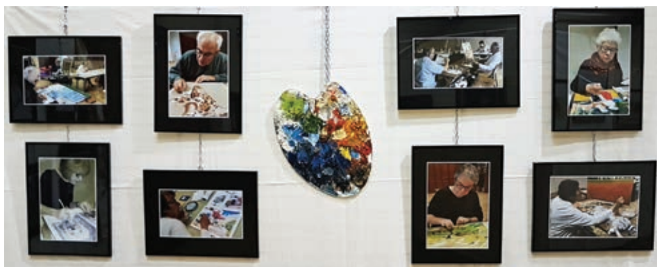
Des artistes concentrés sur leur travail ...

Comme chaque année depuis 15 ans, nos ateliers créatifs ont repris leurs activités début octobre. Ils s'adressent aux adolescents et aux adultes.