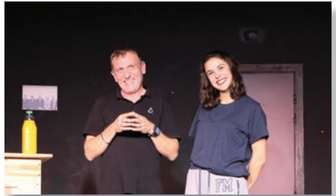
« tel père, telle fille », une comédie de haute facture