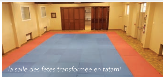
la salle des fêtes transformée en tatami

Le club assure 2 cours par semaine dans la salle des fêtes de Villiers-le-Mahieu. Les élèves, de toutes les catégories d'âge, sont pour moitié des Mahieutins, les autres étant issus des villages alentour.