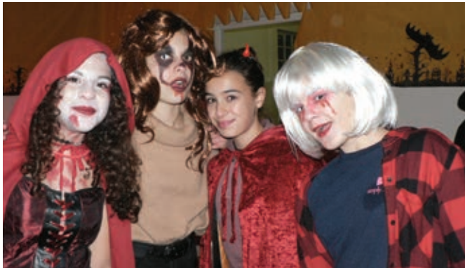
Les ados s'amuse

Elle a ouvert 2018/2019 avec la 4 ème édition de la fête d'Halloween. Affluence toujours aussi forte malgré les vacances scolaires. Sorcières et diabolotins ont parcouru les rues du village pour leur grand plaisir mais aussi celui des Mahieutins qui avaient préparé des bonbons. Aux dernières nouvelles aucun sort n'a été jeté ! Enfants et parents se sont retrouvés à la salle des fêtes pour le traditionnel apéritif, puis nouveauté de l'année, ont prolongé la soirée sur la piste de danse et autour d'une table.