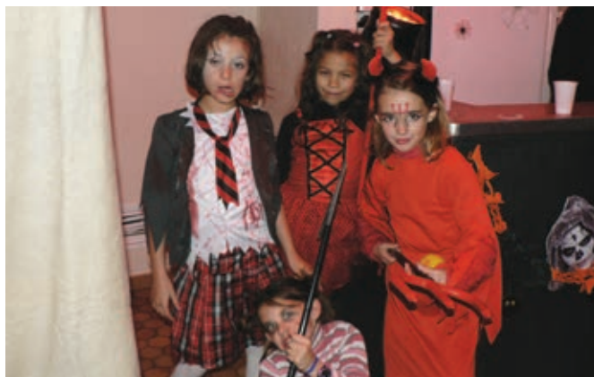
les enfants aussi