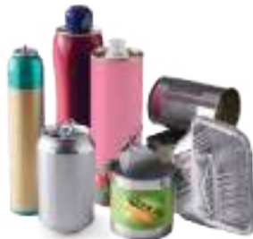
Boîtes de conserve canettes, aérosols, barquettes en aluminium