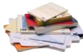
Journaux, magazines, catalogues, livres, cahiers, enveloppes, courriers...