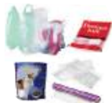
Blisters, films, sacs plastiques